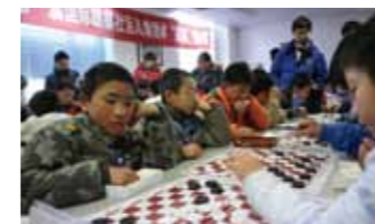
2012 年 12 月 31 日，举行第一届国际跳棋社区儿童团体“星际”锦标赛