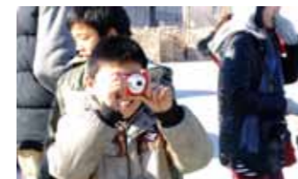
社区机构开设的儿童摄影课程