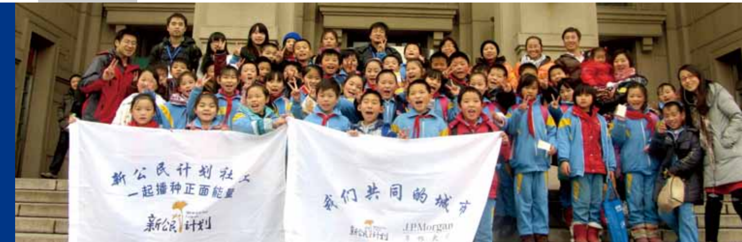
我们共同的城市项目：孩子们走进自然博物馆