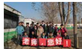
11 月 17 日开展穿越 14 公里徒步北京 7 所打工子弟学校并向老师们的公众倡导活动