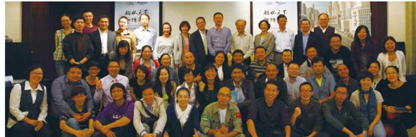
10月10日，候选人见面会后续选人、银杏伙伴、专家评委以及南都公益基金会工作人员合影