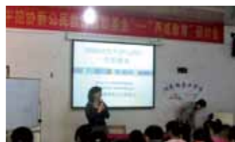
阳光向导工作坊：人际关系主题讲座“一生的朋友”