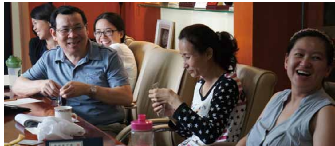
秘书处团国会欢笑不断