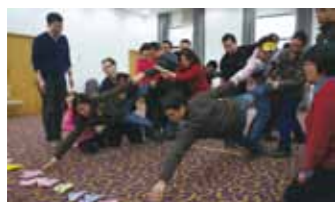
3月1日，银杏伙伴们在做团队建设游戏

》资源对接 为银杏伙伴提供有针对性的资源对接和媒体宣传是“银杏计划”的后续支持内容。2012年银杏计划一向银杏伙伴提供了36次资源对接服务，具体包括学习交流、公益传播、参赛推荐和实物捐赠四大类。例如推荐银杏伙伴参加APEC青年企业家峰会，在豆瓣电台、《碳商》等公众媒体提供广告位等机会，将银杏伙伴引入公众视线。