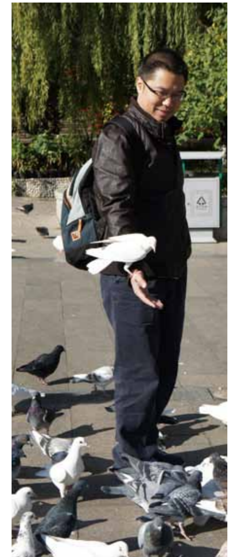
秘书处龙庆峡团队建设活动