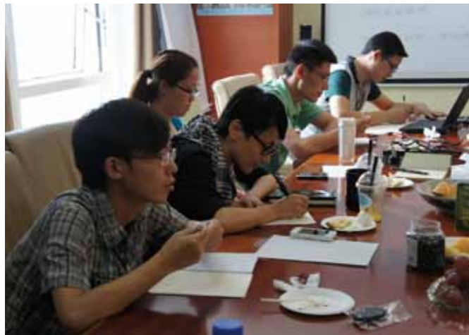
团圆会上秘书处全体相互沟通共同学习