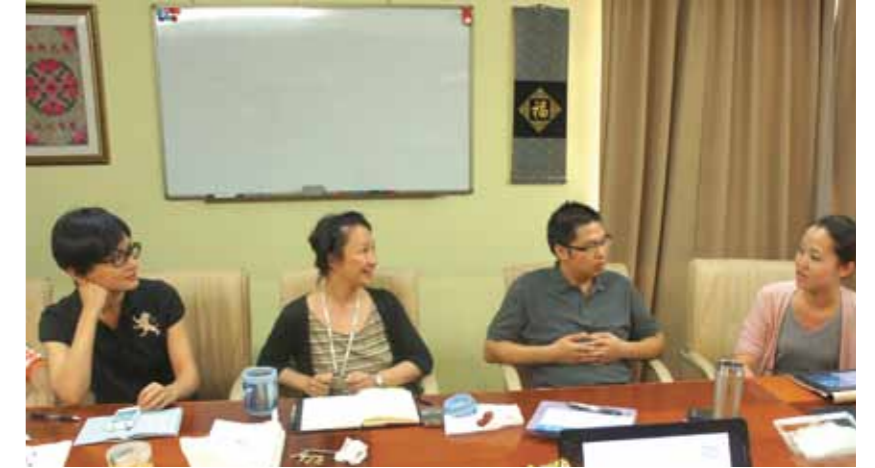
项目官员向大家介绍工作进展