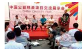
专场推介会活动现场，银杏伙伴赤脚上场，以表“脚踏实地”