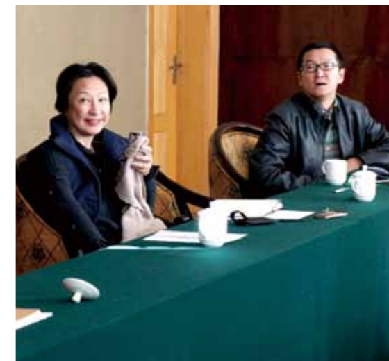
秘书处分享学习“政府-社会组织关系”研究成果