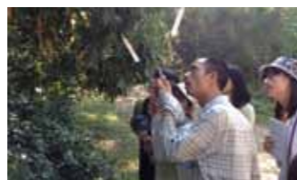
9月16日，银杏伙伴查看台湾桃米社区湿地里的保护树种