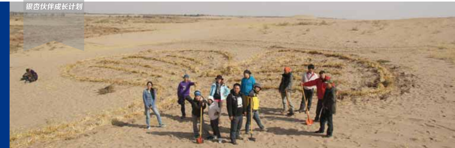
银杏伙伴“民勤行”，伙伴们在“银杏伙伴林”前留影