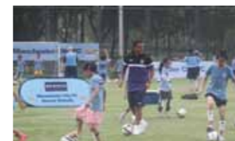
7 月 25 日，70 名学生参加曼城足球俱乐部足球夏令营活动