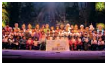
艺术之旅：组织 1500 人次流动儿童观看儿童剧