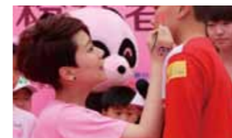
母亲节活动当天，海清与孩子们互动，并呼吁大家关注打工子女群体

传统媒体报道 96 次，新媒体传播超过 1 万余次，得到杨团、杨东平、杨锦麟、杨幂、海清等关心打工子女教育问题的学者、媒体人、明星等人士的转发与关注。发起多次线上线下互动的公众参与活动。