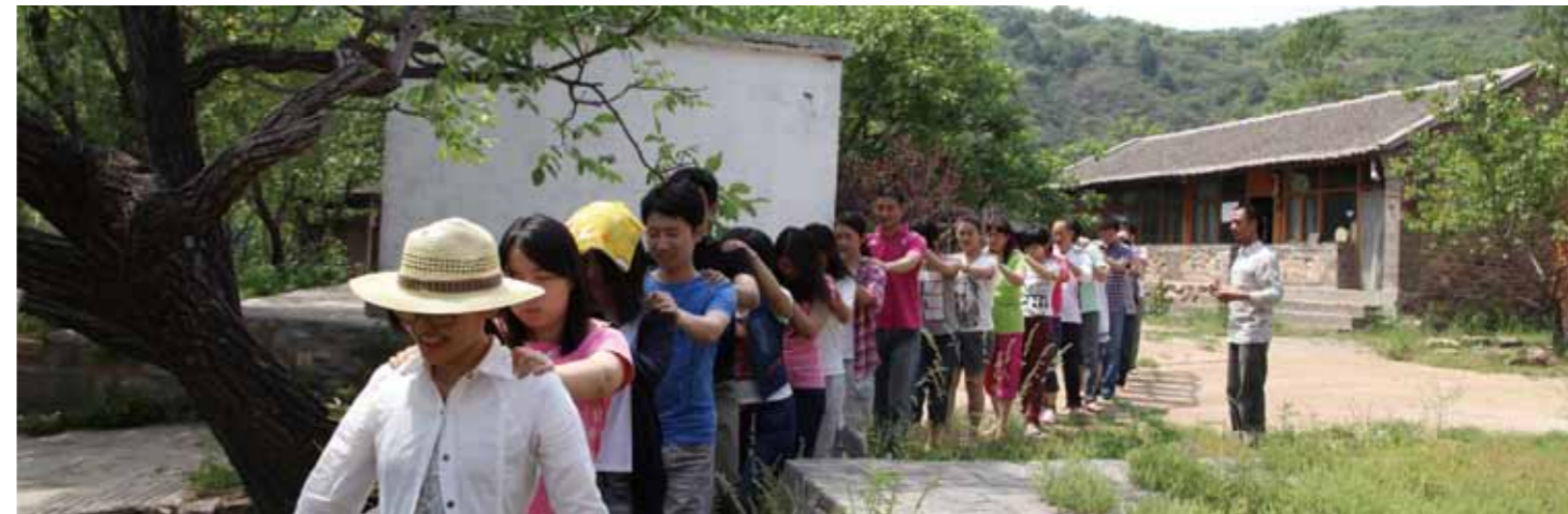
燕山学堂的工作人员（左一）带领媒体朋友赤脚体验与自然亲密接触