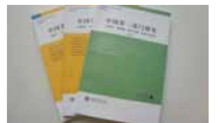
《中国第三部门研究》系列

《中国第三部门研究》南都基金会自 2011 年起开始资助上海交通大学第三部门研究中心主编的《中国第三部门研究》出版。2012 年，南都基金会资助了《中国第三部门研究》第三卷和第四卷。