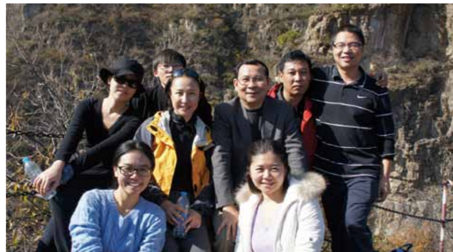
秘书处龙庆峡团队建设活动合影