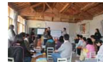
以介绍歌路营城市探索课程为主题的 4 月北京工作坊