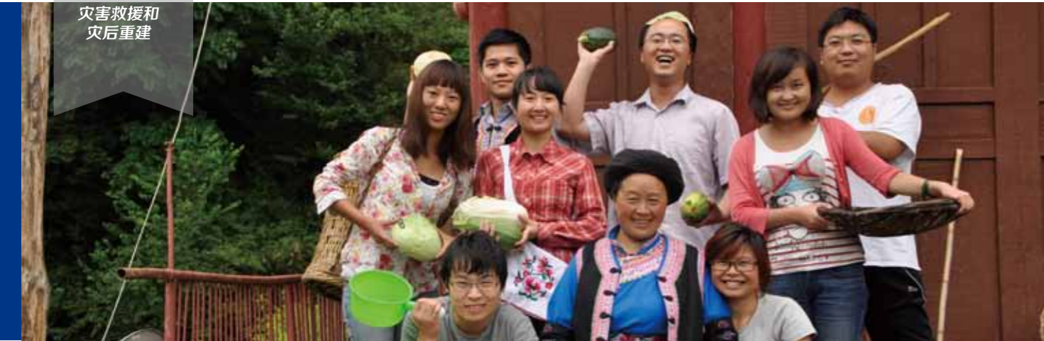
灾后社会损失评估与介入行动研究，高校师生参与乡村生态体验游