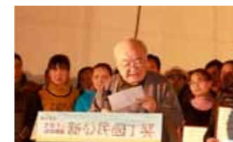
钱理群教授在颁奖典礼上发言

《项目成果》发布9个城市163所学校280位老师的参与的《打工子弟学校教师工作情况调查》报告；2012年共支持来自12个城市421位老师实现教育教学心愿，总支持金额为328,445.3元。