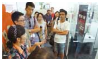
8月6日，银杏伙伴与芯世界50强代表在韩国齐心协力基金会进行交流学习