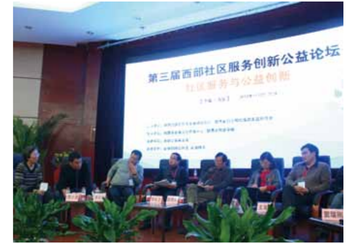
第三届西部社区服务创新公益论坛