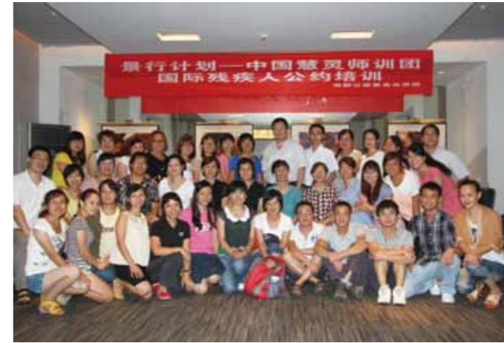
慧灵残疾人国际公约培训合影

“筚路蓝缕，以启山林”出自《左传》，驾着简陋的车，穿着破烂的衣服去开辟山林，以示南都公益基金会和民间公益伙伴们携手共建公民社会，虽任重道远，何其艰难，但乐观前行，永不放弃的决心！