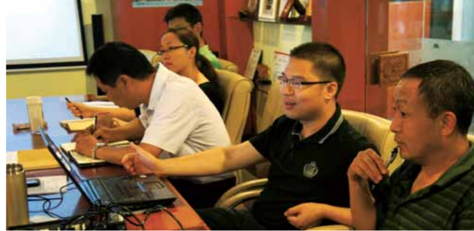
南都公益基金会秘书处团国会