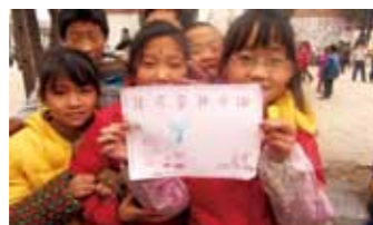
“我爱行动”儿童自主项目——环保在行动